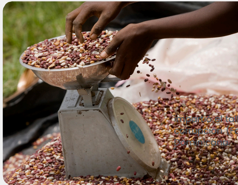
Impacto el total corrupción.

La pérdida y desperdicio de alimentos sigue siendo una preocupación para Organización de las Naciones Unidas para la Alimentación y la Agricultura (FAO), institución que tiene proyectado hacer un levantamiento de manera escalonada en varios sectores de la República Dominicana por la carencia de estadísticas actualizadas sobre el tema, panorama que complica el desarrollo de estrategias para solucionar el problema.